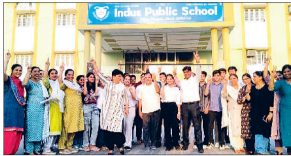
शानदार परीक्षा परिणाम आने पर खुशी जताते इंडस स्कूल के छात्र व स्टाफ।