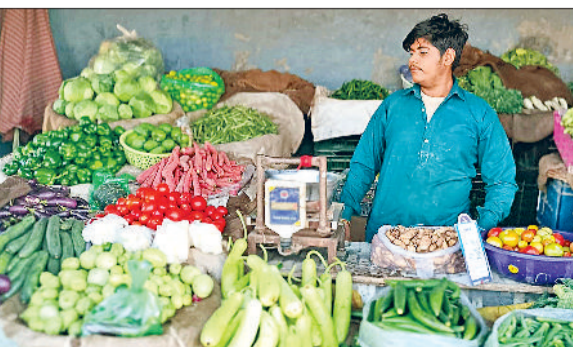
राजौंद। दुकानों पर सजी हुई सब्जियां।

क्षेत्र में जैसे-जैसे गर्मी ने दस्तक देनी शुरू की है, वैसे-वैसे सब्जियों के दामों में भी बढ़ोतरी की आहट साफ नजर आने लगी है। हाल ही में सामने आई एक सूची के अनुसार पहले जहां कई सब्जियां सस्ते दामों पर मिल रही थीं, वहीं अब उनके भाव में धीरे-धीरे बढ़ोतरी देखी जा रही है, जिससे आम लोगों की चिंता बढ़ने लगी है। जानकारी के अनुसार आलू पहले 8-10 रुपये प्रति किलो के स्तर पर था और अभी भी इसी के आसपास बना हुआ है। वहीं बैंगन, टमाटर, गोभी, भिंडी, खीरा, मटर