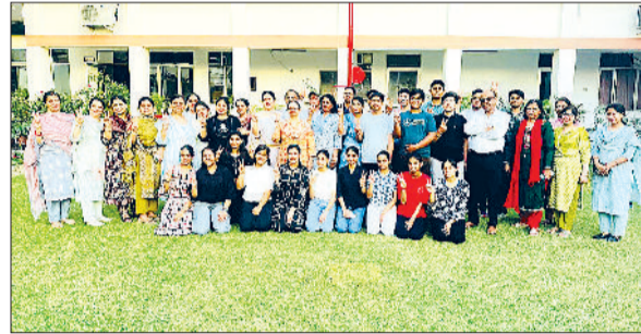
कैथल। अवल रहे आरकेएसडी पब्लिक स्कूल के विद्यार्थी।