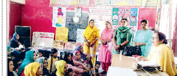
जीद। आंगनबाड़ी केंद्र पर अभिभावकों को प्रेरित करती महिला सुपरवाइजर।

15 अप्रैल को जिला के गांव कर्मगढ़, रामगढ़, श्री रागखेड़ा, कलावती, खेड़ी तलौड़ा, सुदकेन कला, घोघडियां तथा निजानी गांवों में पहुंचकर भजन मंडलियां भजन, गीतों के माध्यम से प्रचार करेंगी। इसी प्रकार 16 अप्रैल को बहलवापुर, धिमाना, नगूरानिम्बान, रामनगर, रिटौली, करसिंधु, रोजखेड़ा, सिंधीखेड़ा, 17 अप्रैल को गांव खोखरी, दालमाला, नगूरानिम्बान, सिन्हाखेड़ी, बेरी खेड़ा, पालवा, घोघडियां, मनोहरपुर, 18 अप्रैल को चाबरी कालोनी जीद, राम कालोनी जीद, रायचंदवाला, सिवानामाल, मलार, कहरसून, रोजखेड़ा, लोहचव में कार्यक्रम होगा।