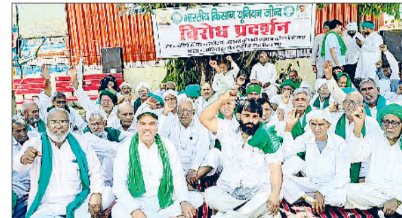
जीद। धरना देकर नारेबाजी करते हुए भाकियू कार्यकर्ता।