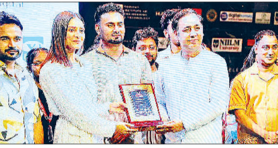
कैथल। बेस्ट कलेक्शन अवॉर्ड से नवाजते अधिकारी।

एनआईआईएलएम युनिवर्सिटी, कैथल ने हरियाणा रनवे फैशन वीक 2026 में एजुकेशन पार्टनर के रूप में अपनी प्रभावशाली उपस्थिति दर्ज कराई। यह प्रतिष्ठित आयोजन द एम्बिएंस, पानीपत में आयोजित किया गया।