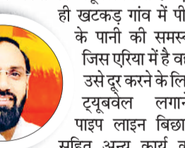
लेकर 34 लाख 7 हजार रुपए की एडमिन अप्रूवल मिलने के बाद जन स्वास्थ्य विभाग ने टेंडर लगाने से पहले जो प्रक्रिया है उसको लेकर कार्यवाही शुरू कर दी है।

लेकर स्वीकृत मिली है। ऐसे ही छातर गांव में पीने की कमी जिस एरिया में है वहां पीने का पानी पहुंचे इसको लेकर ट्यूबवेल लगाने एवं पाइप लाइन बिछाने सहित अन्य को लेकर 40 लाख 59 हजार रुपए के कामों की अप्रूवल मिली है। ऐसे ही खटकड़ गांव में पीने के पानी की समस्या जिस एरिया में है वहां उसे दूर करने के लिए ट्यूबवेल लगाने, पाइप लाइन बिछाने सहित अन्य कार्य को लेकर 34 लाख 7 हजार रुपए की एडमिन अप्रूवल मिलने के बाद जन स्वास्थ्य विभाग ने टेंडर लगाने से पहले जो प्रक्रिया है उसको लेकर कार्यवाही शुरू कर दी है।