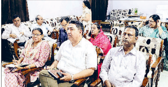
जींद। बैठक में भाग लेते हुए अधिकारी।

हरियाणा के विद्यालय शिक्षा विभाग ने निपुण मिशन के तहत 'क्लासरूम रेडीनेस प्रोग्राम' के सफल क्रियान्वयन के लिए एक व्यापक नीति तैयार की है। इस अभियान को जमीनी स्तर पर प्रभावी बनाने के उद्देश्य से आज अतिरिक्त मुख्य सचिव, निदेशक मौलिक शिक्षा और एसपीडी समग्र शिक्षा ने वीडियो कॉन्फ्रेंसिंग के माध्यम से राज्यभर के शिक्षा अधिकारियों के साथ एक महत्वपूर्ण बैठक की। जिला शिक्षा अधिकारी कार्यालय में आयोजित इस वर्चुअल बैठक में जिला शिक्षा अधिकारी, जिला मौलिक शिक्षा अधिकारी, खंड शिक्षा अधिकारी और जिला समन्वयक एच एल एन सहित कई अधिकारियों ने भाग लिया।