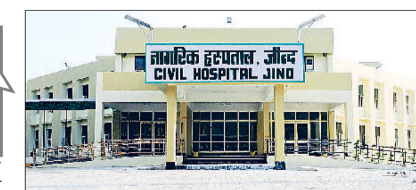
जीद। नागरिक अस्पताल का फोटो।

जिले में मरीजों को मिलने वाली सुविधाएं अन्य विभागों के कारण लटक रही हैं। पालीक्लीनिक में जहां कैथ लेब स्थापित होनी है, उन कमरों में आयुष विभाग का पंचकमा व फूड एंड ड्रग एडमिनिस्ट्रेशन का कार्यलय है। इसके अलावा नागरिक अस्पताल में जहां पर एमआरआई स्थापित की जानी है, वहां पर महिला एवं बाल विकास विभाग द्वारा वन