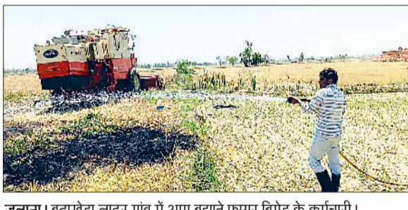
गुलाना। बुढ़ाखेड़ा लाटर गांव में आग बुझाते फायर ब्रिगेड के कर्मचारी।

क्षेत्र के बुढ़ा खेड़ा लाटर गांव में उस समय अफरा-तफरी मच गई जब गेहूँ की कटाई कर रही एक कंबाइन मशीन से अचानक चिंगारी उठी और देखते ही देखते खेत में खड़ी फसल ने आग पकड़ ली। आग लगते ही आसपास मौजूद किसानों में हड़कंप मच गया और शोर सुनकर बड़ी संख्या में ग्रामीण मौके पर एकत्रित हो गए। ग्रामीणों और किसानों ने बिना समय गंवाए अपने स्तर पर आग बुझाने का प्रयास शुरू कर दिया। बाल्टियों, ट्यूबवेल के पानी और अन्य साधनों की मदद से काफी