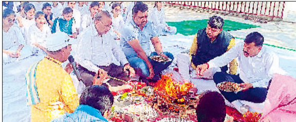
कैथल। हवन में आहुतियां डालते हुए प्रबंधक सदस्य व स्कूल स्टाफ।