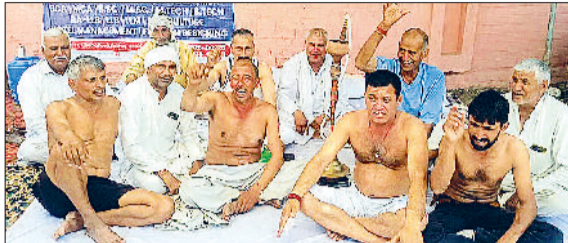
जीद। धरने पर सरकार के खिलाफ नारेबाजी करते हुए किसान।